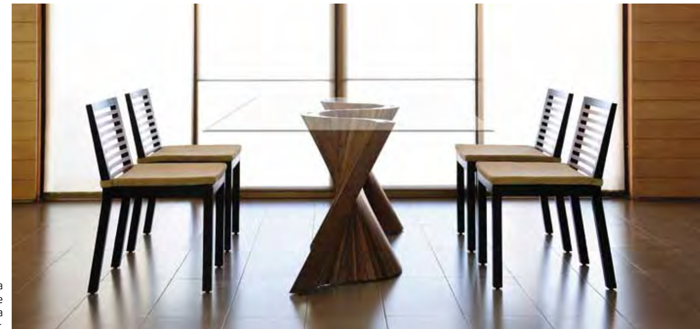
Mesa Wave hecha en madera. Su base escultórica recuerda las olas del mar.

mos el programa de Diseño de Producto en la Universidad de Filipinas. Es un proyecto en pro-ceso, respetando los principios del trabajo arte-sanal, donde las clases son talleres. Tomamos a los estudiantes como aprendices y cuando se agradúan enganchamos a muchos de ellos.